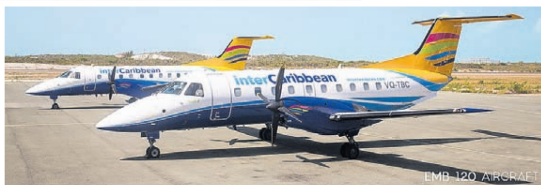
EMB 120 AIRCRAFT

E aerolinea ta conecta 22 destinacion y 14 pais den Caribe. Nan lo aña un Embraer 145 jet cu ta un avion di 50 pasahero cu lo forma parti di e flota di Twin Otter y Embraer 120.